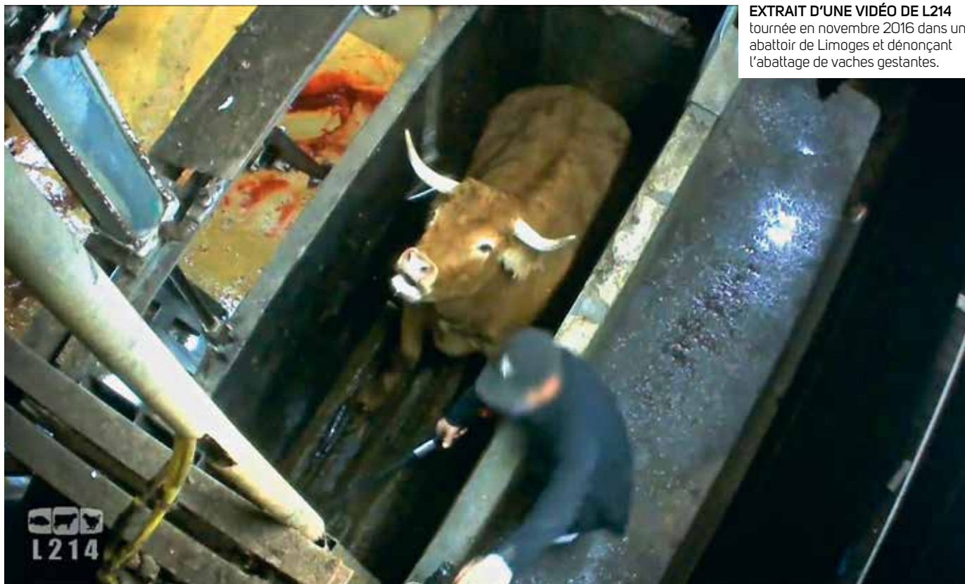
EXTRAIT D'UNE VIDÉO DE L214 tournée en novembre 2016 dans un abattoir de Limoges et dénonçant l'abattage de vaches gestantes.